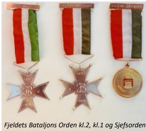
Fjeldets Bataljons Orden kl.2, kl.1 og Sjefsorden